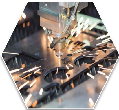
Metalurgia e Metalomecânica