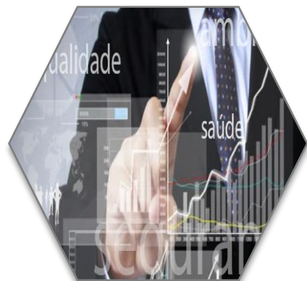
Qualidade e ambiente