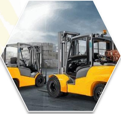
Condutores/Manobradores de Equipamentos