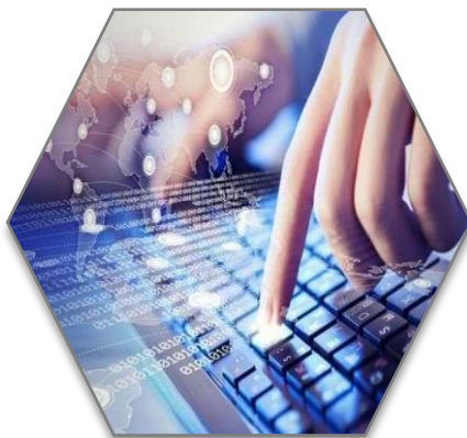
Línguas e Informática