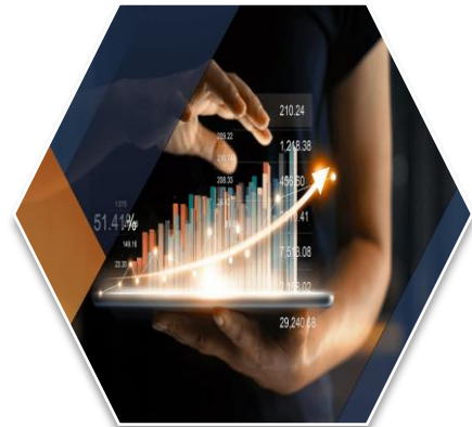
Gestão e Comércio